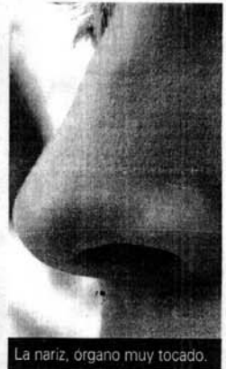
La nariz, órgano muy tocado.